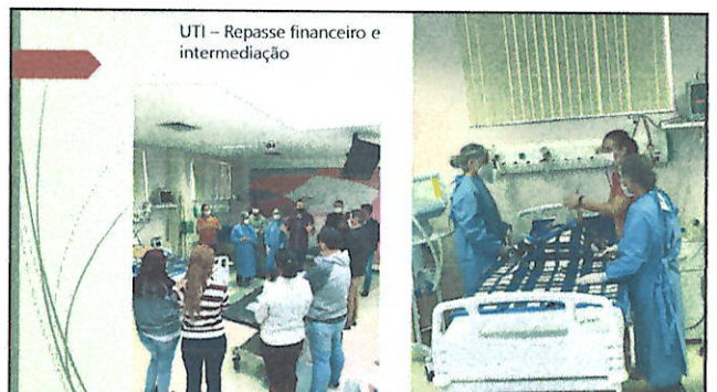
UTI – Repasse financeiro e intermediação