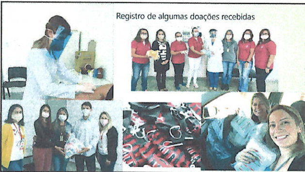
Registro de algumas doações recebidas